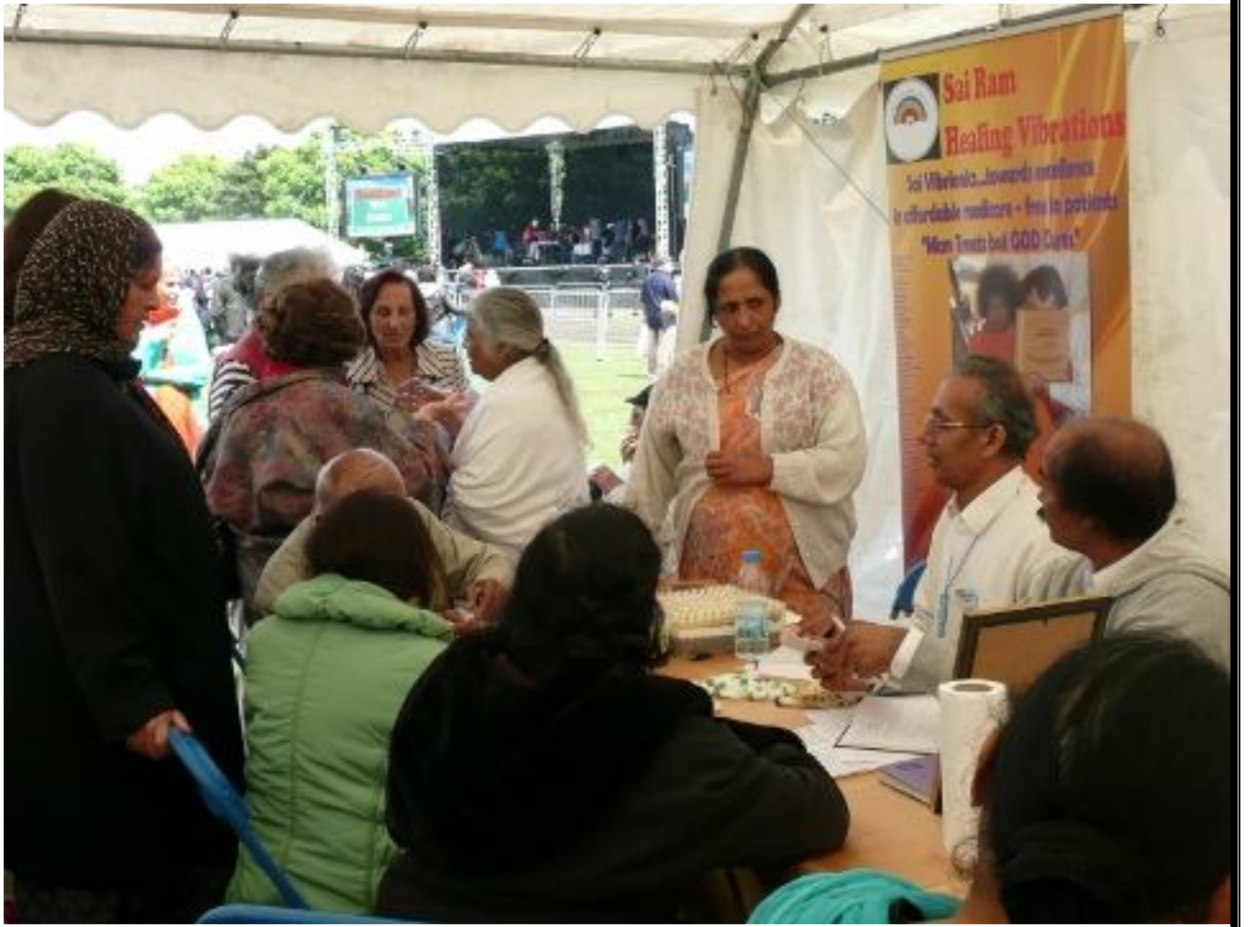
సాతాల్ పార్క్, లండన్ లో ఫైథ్ పండుగ యొక్క యూనిటీ వద్ద Vibrionics దుకాణము