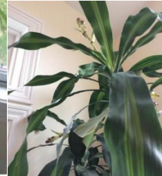
Second view, October 2014