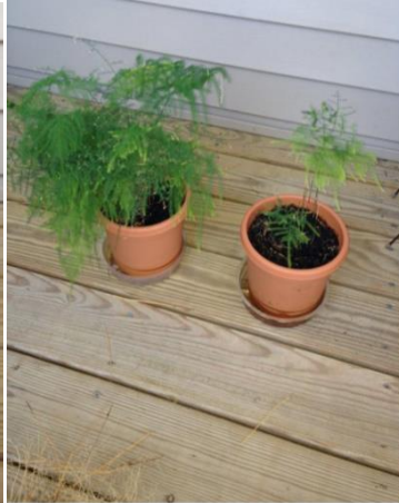
On right, October 2013