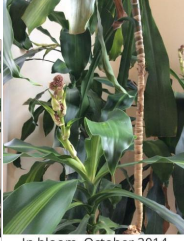
In bloom, October 2014