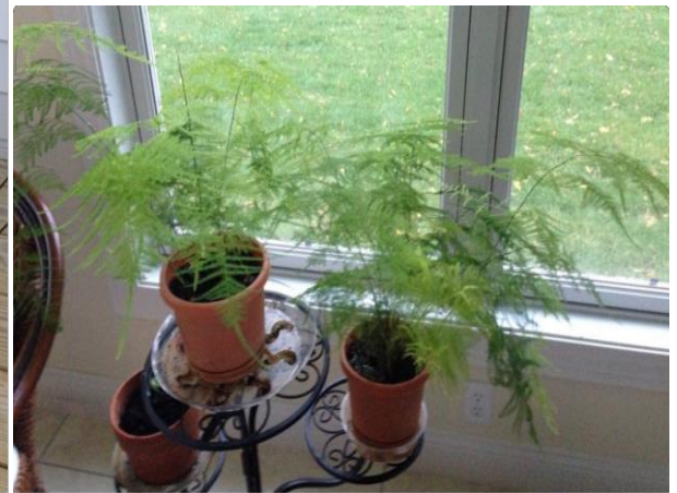
On right, October 2014