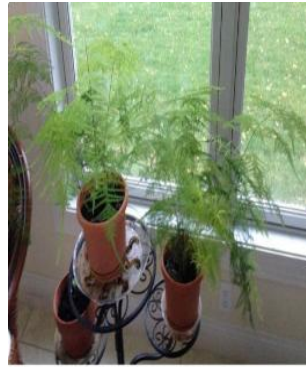
On right, October 2014