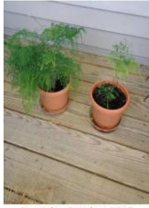
On right, October 2013