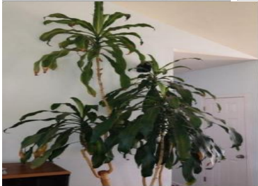
Corn plant, August 2013