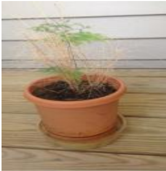
Fern, August 2013