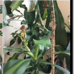
In bloom, October 2014