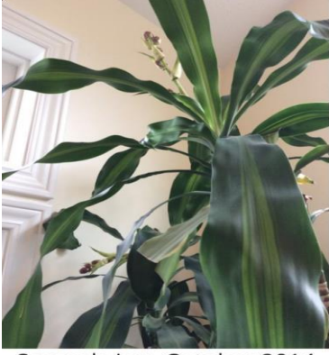
Second view, October 2014