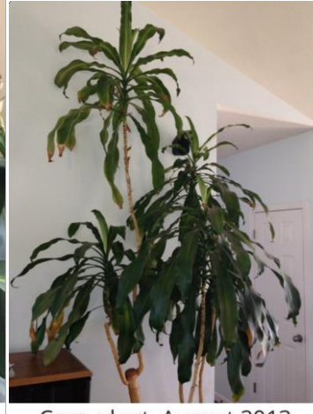
Corn plant, August 2013