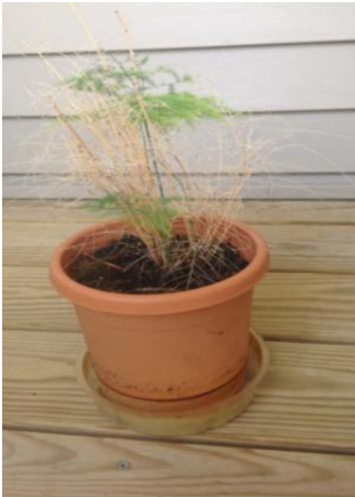
Fern, August 2013

నేను వాటికి యిచ్చినవి: #CC1.2 Plant tonic + CC15.1 Mental & Emotional tonic... 3TW నీటిలో కలిపితిని.