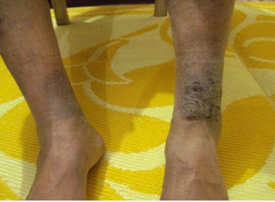
Photograph taken on 08/07/2012