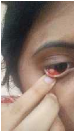
Día 2 (22 agosto)