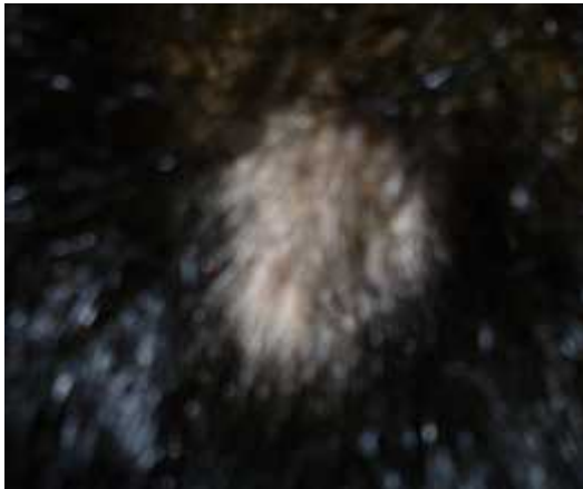
28 Marzo 2015

En noviembre de 2014, mi hijo fue diagnosticado con alopecia areata. Tenía un parche calvo en su cabeza del tamaño de una moneda de 20. Recibió tratamiento en el hospital y se le dieron tabletas y cremas e inyecciones, pero el parche calvo no mostraba mejoría. En marzo de 2015 vinimos a la clínica Vibriónica en el Centro Sathya Sai Baba SS3. Oramos a Swami y empezamos el tratamiento de Vibriónica. Con la Gracia de Dios y bendiciones, el espacio calvo fue cubierto con nuevo cabello para mayo de 2015. Queremos agradecer a Bhagavan y a su buen practicante de Vibriónica por curar a nuestro hijo.