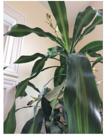
Second view, October 2014

Este año (2014) tuvo gran florecimiento y la fragancia es más dulce y más fuerte. Estas fotos muestran la planta a su llegada en agosto 2013, en octubre 2013 y florecida en octubre 2014.