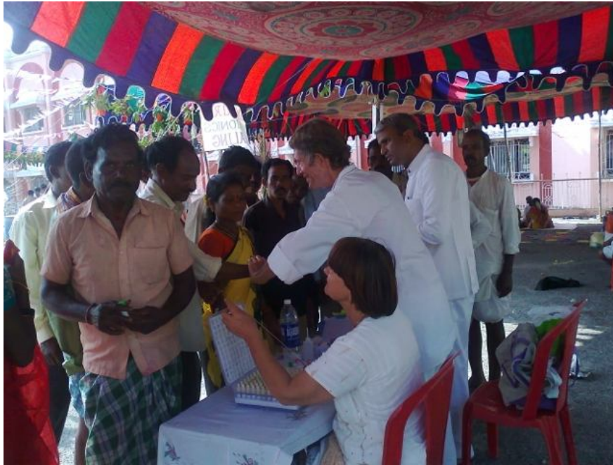
Campamento Médico 21-23 Noviembre 2012 en PN Estación del Ferrocarril, Puttaparthi