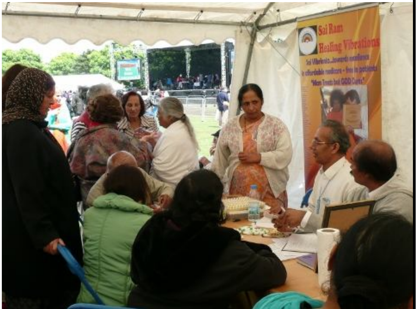
Puesto de Vibrionica en el Festival de la Unidad de las Religiones en el Southall Park, Londres