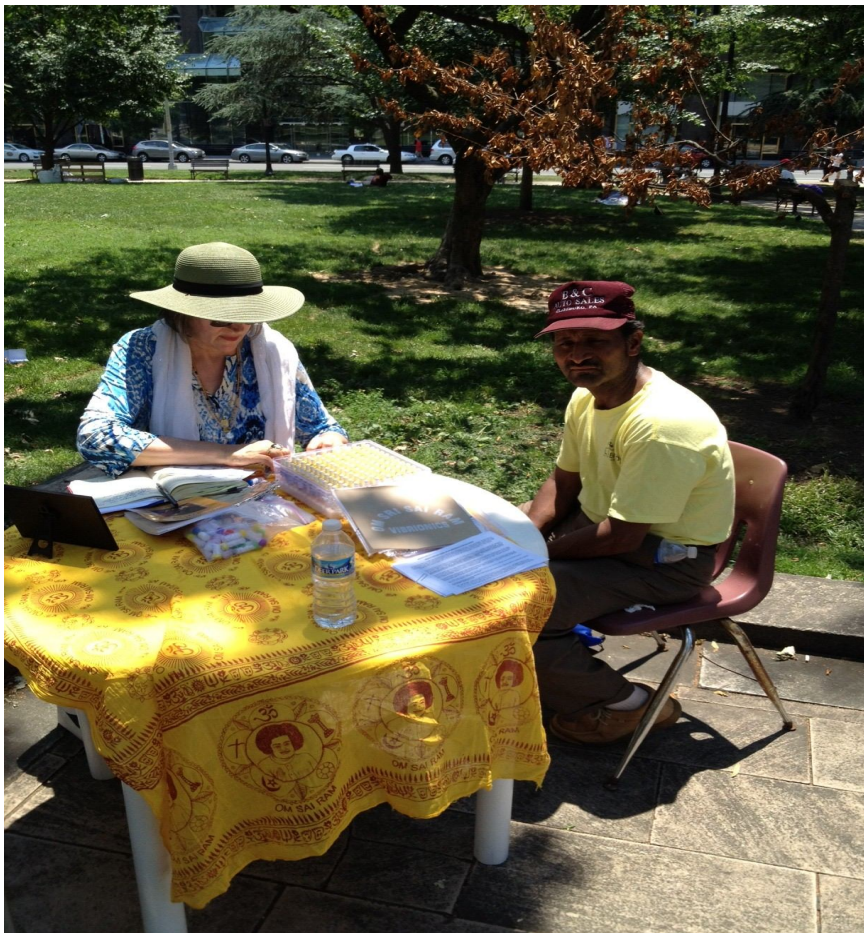
Vibrionica en el Parque – Sirviendo a los sin hogar Washington DC USA