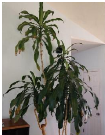
Corn plant, August 2013

na praproti po selitvi avgusta 2013, že dva meseca oktobra 2013 in že eno leto oktobra 2014. Dracaena fragrans (hišna koruza) kaže posebno spremembo.