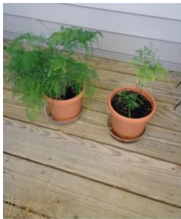
On right, October 2013