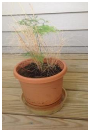
Fern, August 2013

Od takrat rastline redno dobivajo zdravilo 2TW . Velike rastline dobivajo 6-8 skodelic vode in manjše dve skodelici vode z zdravilom.