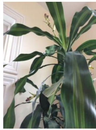
Second view, October 2014

Vsako leto cveti s posebnim vonjem sladkega jasmina. Lani sploh ni cvetela (2013). Letos ima velike cvetove (2014) in še močnejši vonj, ki napolnjuje vse sobe hiše. Priložene slike kažejo rastlino v treh obdobjih: avgusta 2013, oktobra 2013 in v cvetu oktobra 2014.