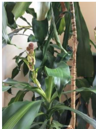
In bloom, October 2014