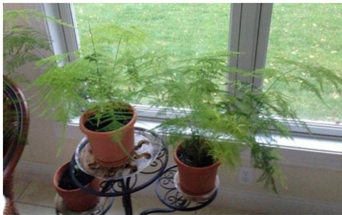
On right, October 2014

Po enem letu so rastline svetlo zelene in skoraj dvakrat veje! Razlika je najbolj očitna na sliki ene praproti.