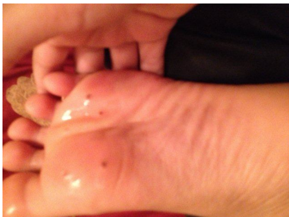
Po 1 mesecu zdravljenja