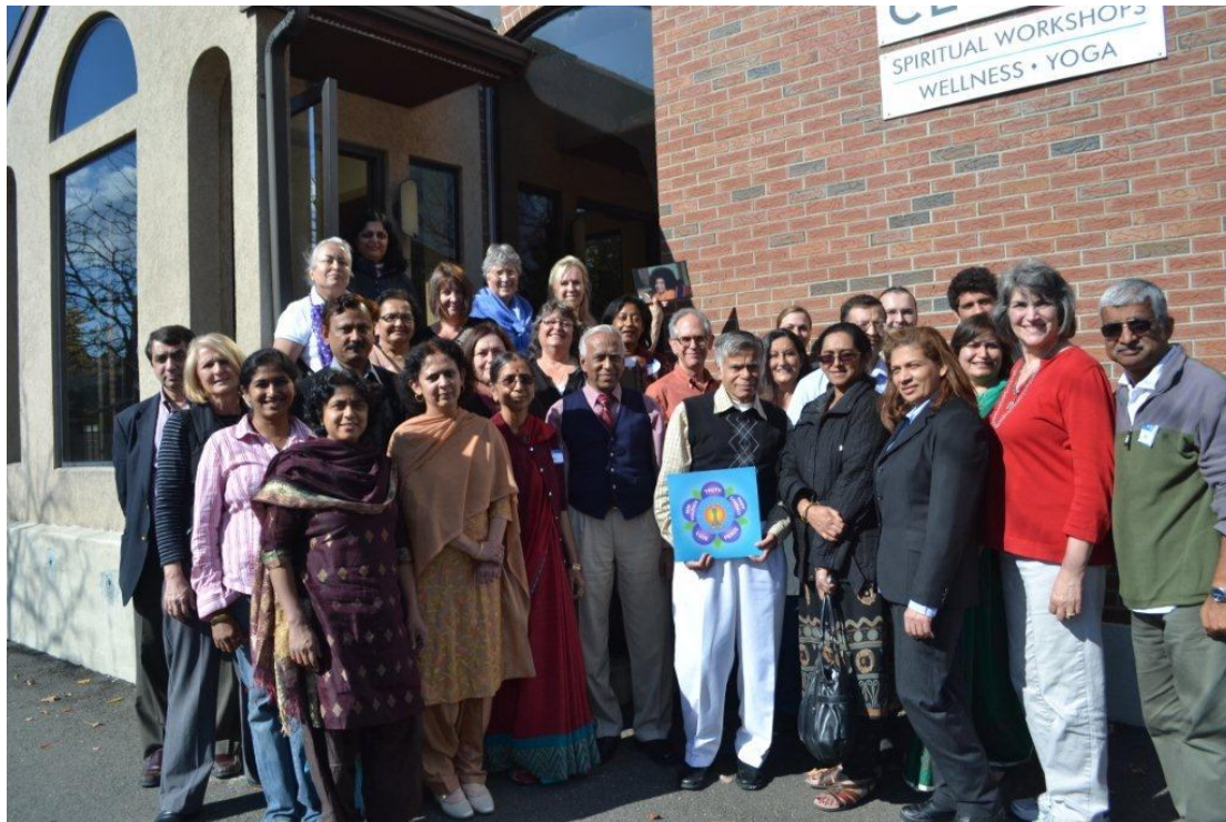
JVP skupina (začetniki) 20-21 Oktober 2012 v Hartfordu, CT USA