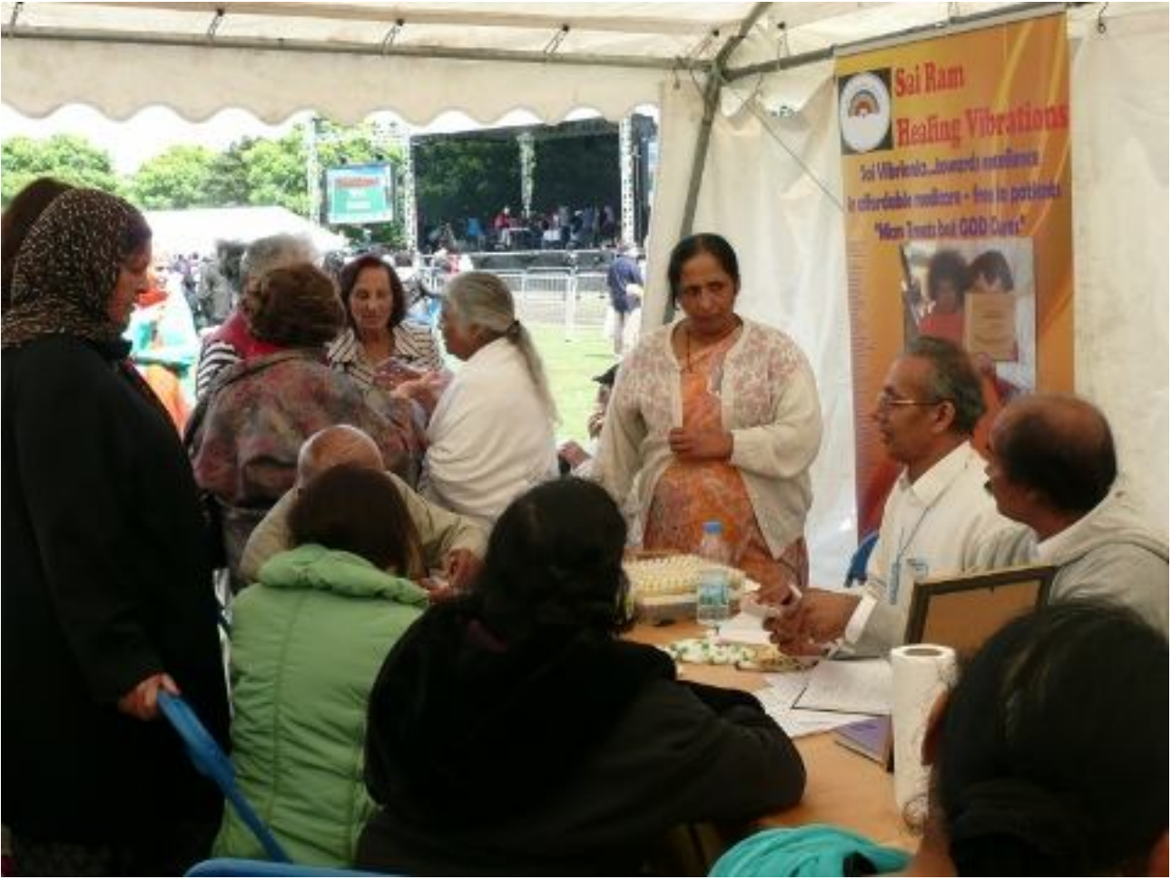
Vibrionics stall at the Unity of Faiths festival in Southall Park, London