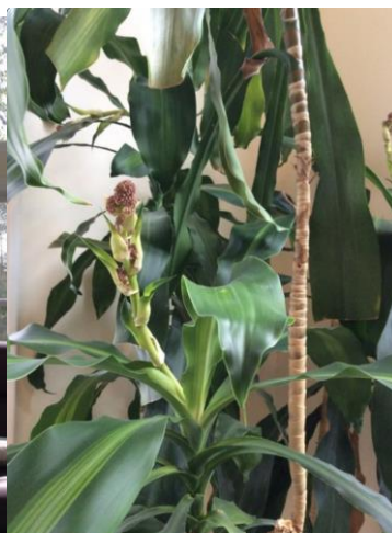
In bloom, October 2014