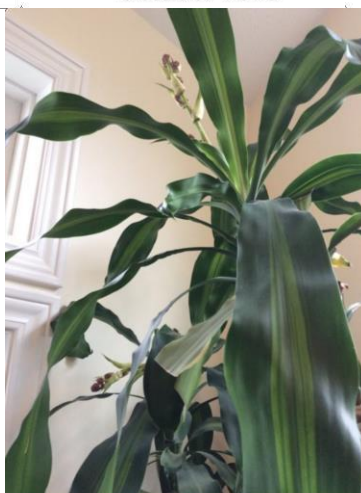
Second view, October 2014