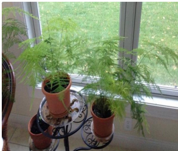
On right, October 2014

Другой пример - растение Dracaena fragrans (комнатная кукуруза). Обычно оно цветёт каждый год, но в 2013 году оно не цвело совсем. Зато в 2014 году оно цвело особенно сильно, и запах был сильнее и