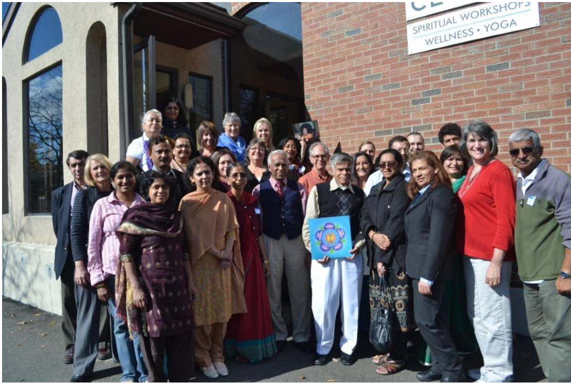
Участники семинара для начинающих практикующих. 20-21 октября 2012 в Хартфорде, США