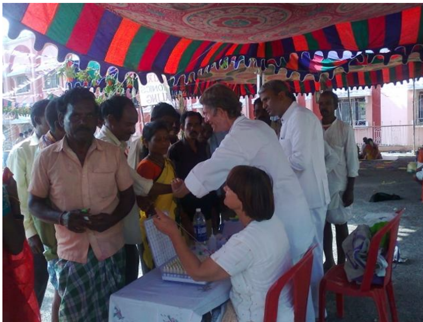
Выездная клиника 21-23 ноября 2012 на железнодорожной станции в Путтапарти