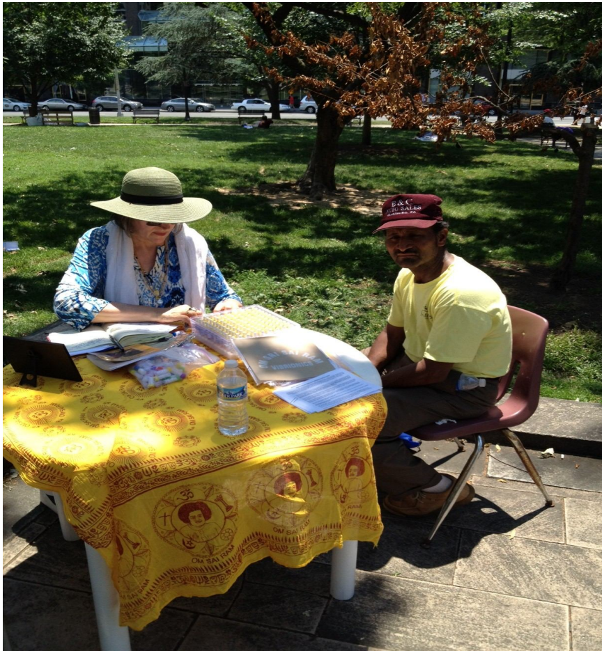
Вибрионикс в парке - помогая бездомным. Вашингтон, США