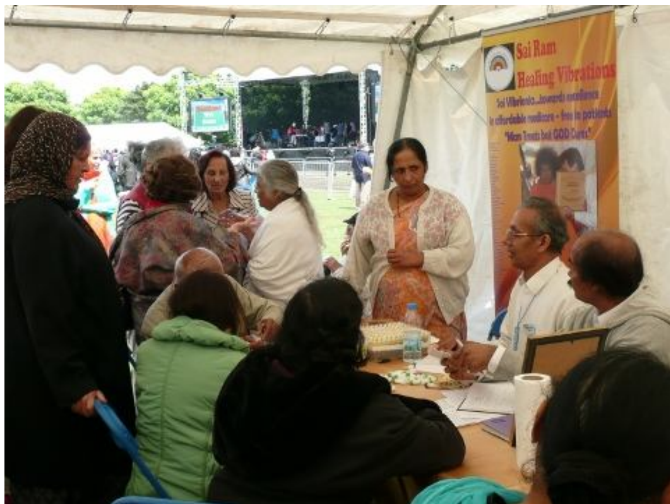
Павильон Вибрионикс на Фестивале Единства Вероисповеданий в парке Сауфхол в Лондоне