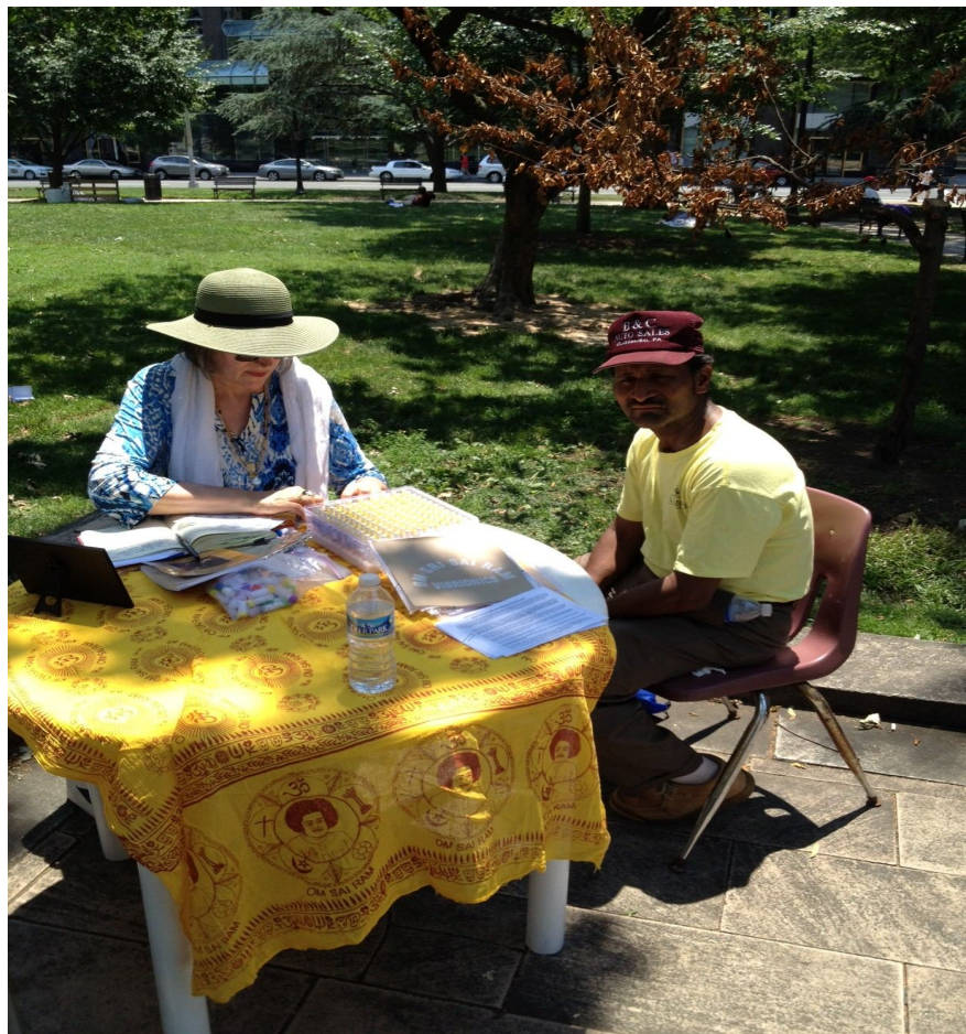
Wibronika w Parku w Waszyngtonie, USA. Służba dla bezdomnych