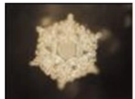
Love and Gratitude

In un certo senso, noi siamo realmente dei serbatoi d'acqua mobili che risiedono in un corpo. La qualità dell'acqua dentro di noi è quindi direttamente collegata al tipo di esseri umani che siamo 13 ! Questo indica probabilmente che, finché siamo sotto il controllo mentale/emozionale dei sei nemici di desiderio, collera, orgoglio, avidità, attaccamento e gelosia, l'acqua all'interno del nostro corpo, cervello e cuore non sarà pura. Possiamo purificare e caricare l'acqua dentro e intorno a noi collegandoci ad essa con positività, Amore e Gratitudine. In tal modo, l'onnipresente acqua in tutte le sue forme può costituire un mezzo per diffondere pace, amore e gioia in tutto l'universo; questo tornerà a noi per riflesso, reazione e risonanza.