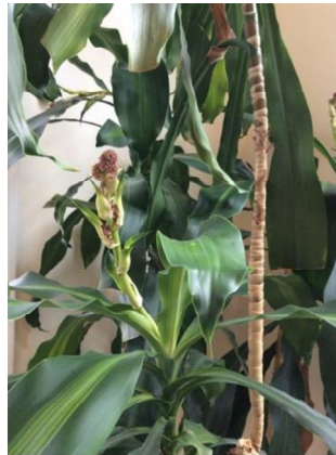
In bloom, October 2014

Più di un anno dopo, le piante sono di un verde brillante e sembrano quasi raddoppiate di dimensione! La differenza si può notare specialmente