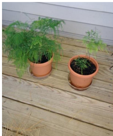
On right, October 2013