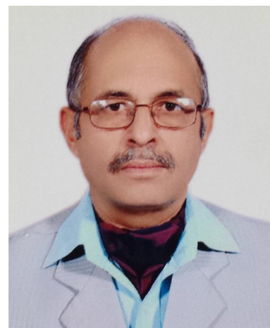
Om Sai Ram

+++++ Le Praticien 11964...Inde a été introduit à Vibrionics le jour du Nouvel An 2014. Rapidement, il s'est perfectionné pour devenir Praticien Vibrionics. Si grands étaient son enthousiasme et son dévouement à Vibrionics qu'il est devenu Senior Praticien après seulement un an de pratique. Immédiatement après, il a participé à la rédaction / édition des cas traités. Voyant une opportunité considérable de mettre en œuvre des normes mondiale dans l'organisation Vibrionics, il a récemment pris la charge totale des demandes d'adhésion à l'Association Internationale Sai Vibrionics Praticiens (IASVP). Il est assisté dans cette tâche par deux Seniors Praticiens 11271 & 11231...Inde très dévoués qui sont responsables de la production et de l'expédition des cartes d'adhésion. Nous exprimons notre reconnaissance pour ce très important travail qu'ils font.