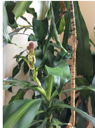
In bloom, October 2014