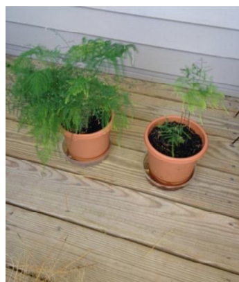
On right, October 2013