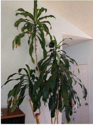
Corn plant, August 2013

en octobre 2014 la Dracaena fragrans (plante maïs d'intérieur) en particulier a subi un énorme changement. Elle fleurit généralement chaque année