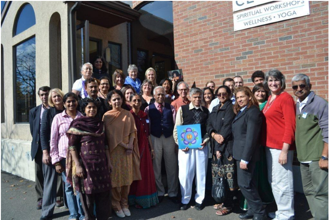
Cours de formation JVP des 20-21 octobre 2012 à Hartford CT USA