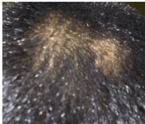
9 Mai 2015