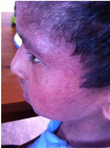
12 April 15

Per Oktober 2015 geht es dem Jungen sehr gut, wenn er jedoch etwas aß, das er nicht gut vertrug bekam er immer wieder kleine Schübe. Er wusste aber wie er die Schübe kontrollieren konnte. Er nahm dann # 3...TDS bis sich seine Haut wieder beruhigt hatte und reduzierte dann wieder auf BD und dann auf OD .