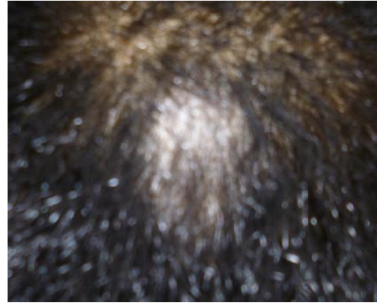
18 April 2015