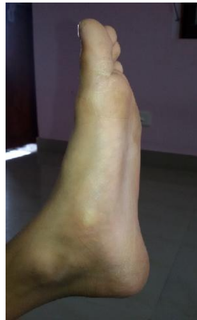
nach der Behandlung (26 Oktober)