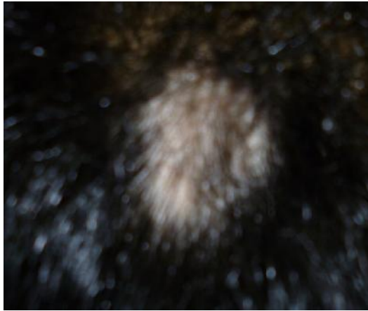
28 März 2015