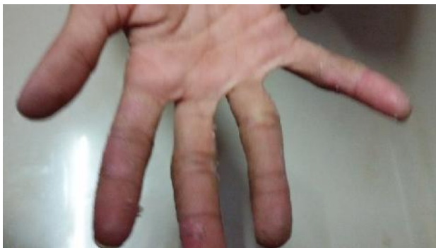
Hand vor der Behandlung (9 April 2015)