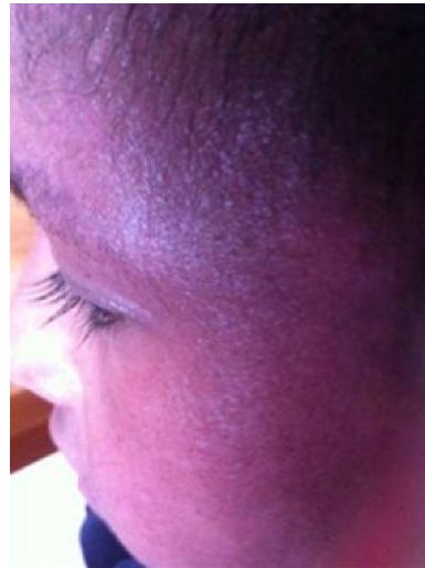
9 May 15