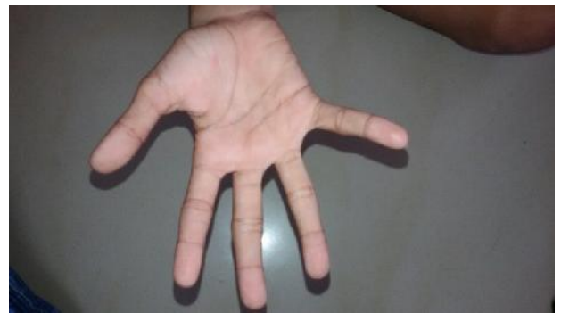
nach der Behandlung (26 Oktober)