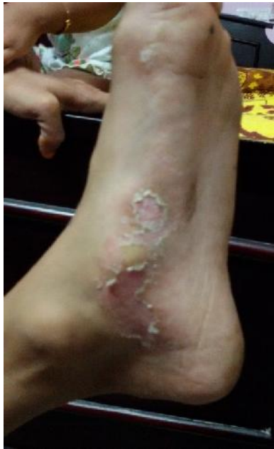
Knöchel vor der Behandlung (9. April 2015)

Die Eltern des Jungen sind sehr glücklich. Sie sind Swami für diese komplette Heilung sehr dankbar. Sie sind auch dankbar, dass ihr Sohn von eventuellen Nebenwirkungen der Steroide verschont geblieben ist.