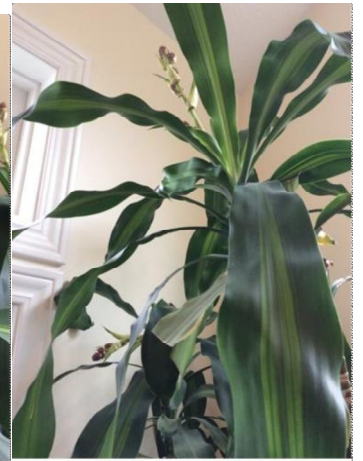
Second view, October 2014