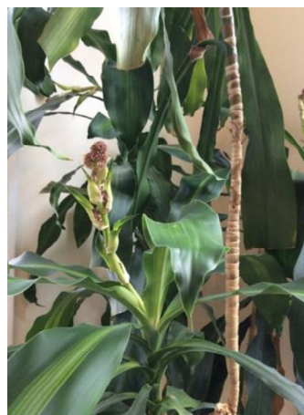
In bloom, October 2014

einem Jahr sind die Pflanzen nun glaenzend und gruen und haben sich in der Groesse fast verdoppelt. Der Unterschied kann besonders bei einem Foto von einem Farn gesehen werden. Diese Pflanze hatte beim Umzug am meisten gelitten. Bei diesem Farn kann ein auffallender Unterschied nach dem Umzug 2013, 2 Monate spaeter im Jahr 2013 und ein Jahr spaeter im Jahr 2014 gesehen werden. Die dracenafragrans