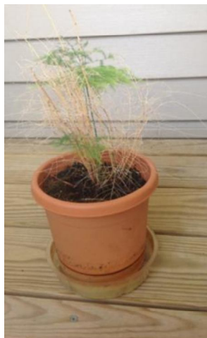
Fern, August 2013

CC1.2 Plant tonic + CC15.1 Mental & Emotional tonic...3TW in Wasser zubereitet.