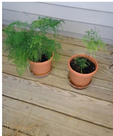
On right, October 2013

Nach 2-monatiger Behandlung haben Sie sich die Pflanzen erholt