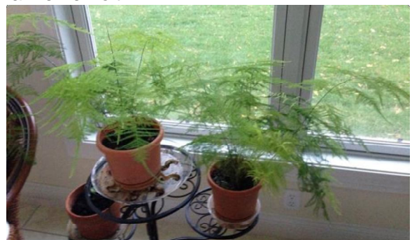
On right, October 2014

Nach 2-monatiger Behandlung haben Sie sich die Pflanzen erholt