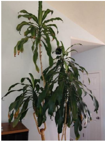
Corn plant, August 2013

und gedeihten. Ich moechte Ihnen nun eine Aktualisierung anbieten. Seit diesen Zeitpunkt haben die Pflanzen die Heilmittel 2TW bekommen. Die groesseren Pflanzen bekommen etwa 6-8 Tassen mit Vibrionics aufgeladenes Wasser und die kleineren Pflanzen erhalten 2 Tassen dieses Wassers Nach mehr als