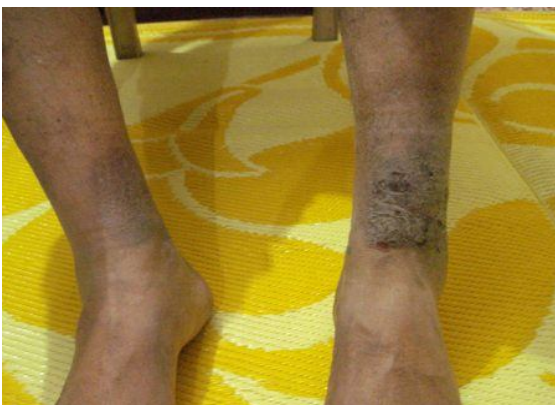
Photograph taken on 08/03/2012