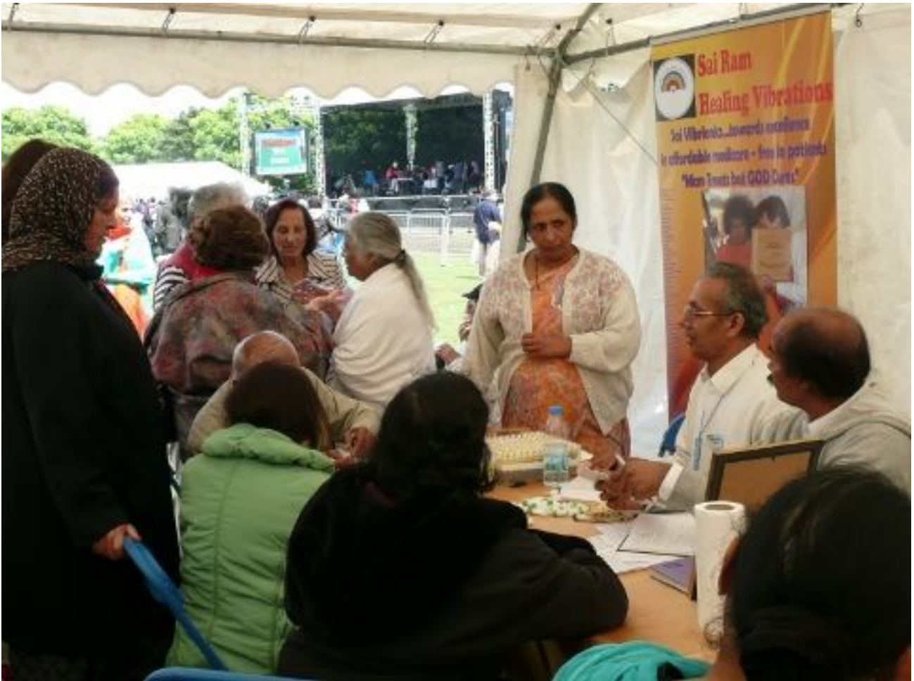
Vibrionics Stand beim Festival für die Einheit aller Glaubensrichtungen in Southall Park, London